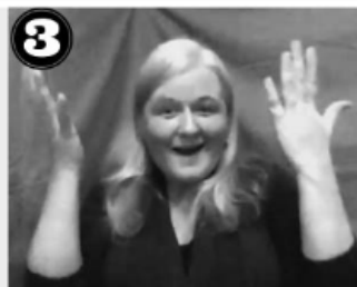
3 ÉCOLES GADBOIS ET LUCIEN-PAGÉ