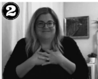
2 SERVICES LINGUISTIQUES CB