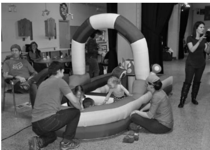
Les enfants se sont bien amusés dans le jeu gonflable du bateau.