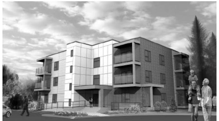
Prise avant de l'immeuble.

Voici une ébauche des logements qui montre des prises de vue de l'avant et l'arrière de l'immeuble qui sera érigé au 15, rue du Sommet à Gatineau, à quelques minutes du centre-ville de Gatineau et à proximité du parc de la Gatineau avec ses activités pour adeptes de plein air, marche cyclisme, ski de fond, etc.