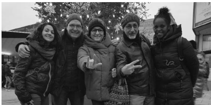
Rencontre et souper amical au restaurant Cage aux Sports sur la rue Sainte-Catherine avant le spectacle les MALOES.