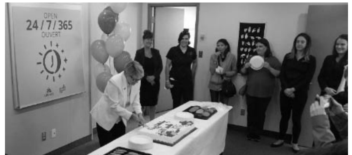
Des membres de la communauté des Sourds d'Ottawa-Gatineau se réunissent pour célébrer le premier anniversaire de SRV Canada VRS.