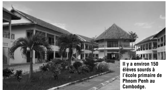
Il y a environ 150 élèves sourds à l'école primaire de Phnom Penh au Cambodge.

En conclusion, j'ai beaucoup aimé mon voyage, mes visites dans ces écoles m'ont permis d'avoir un aperçu de la réalité de l'éducation des Sourds en Asie du Sud-Est. Certains pays favorisent l'éducation des jeunes Sourds dans des écoles spéciales tandis que d'autres encouragent l'intégration en milieu régulier. Je suis conscient que j'ai un regard partiel, cependant je veux parfaire mes connaissances par d'autres visites. J'ai rencontré des personnes formidables et passionnées par l'éducation des Sourds. Ce voyage m'a aussi permis de visiter des lieux extraordinaires et à goûter à la gastronomie de chacun de ces pays. ■