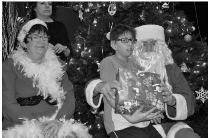
La Fée de l'Étoile et le Père Noël s'amuse à recevoir les enfants qui désirent un cadeau.