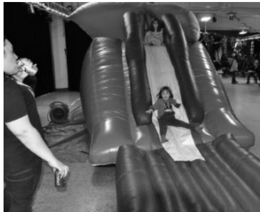
Le gros jeu gonflable en château de pirates a fait le bonheur des enfants qui ne s'arrêtaient pas de jouer et de glisser.