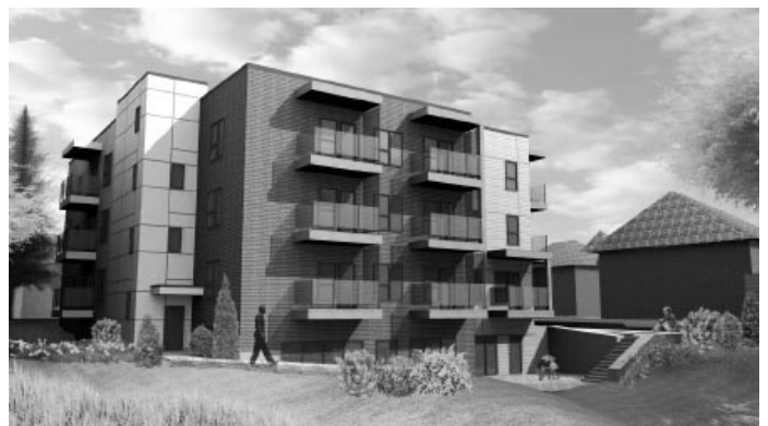
Prise arrière de l'immeuble.

L'ADOO est présentement en campagne de financement afin d'aider à réduire les coûts du projet. Toute personne qui veut contribuer peut le faire en achetant « la brique de la solidarité » sur le site Web de l'ADOO : www.adoo.ca